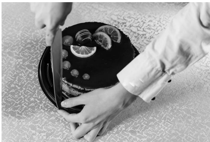
Рис. 20. Зафиксируйте свободной рукой верхнюю точку на блюде или основании упаковки и закрепите нож

Для того чтобы сделать аккуратный разрез, свободной рукой зафиксируйте место на блюде или основании упаковки, откуда будете начинать разрез (на 12 часах), после того как нож будет закреплен на торте в этом месте, перенесите свободную руку вниз (на 6 часов) и осуществляйте разрез, двигаясь к свободной руке (рис. 20, 21).