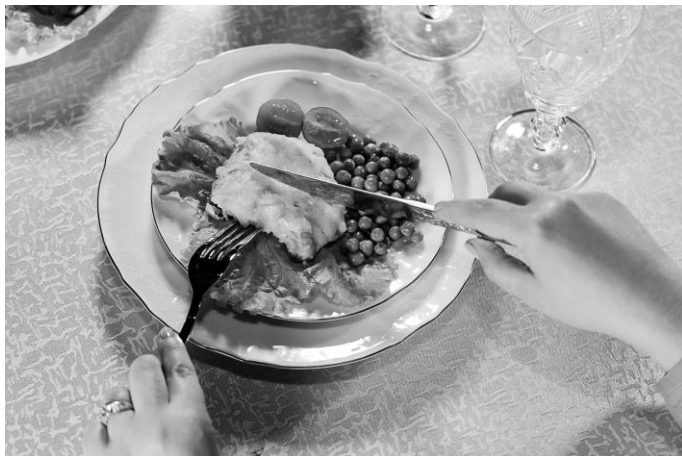
Рис. 9. Удерживание ножом куска мяса на тарелке