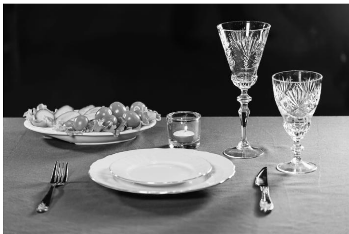
Рис. 23. Праздничная сервировка стола

ки для десерта кладут за тарелкой сверху. Расстояние между приборами составляет примерно 1 см (рис. 23).