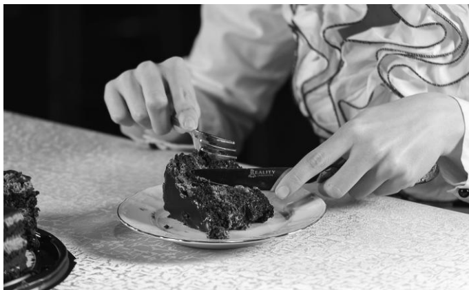
Рис. 16. Удерживание кусочка торта столовым ножом

макаруны, буше, эклеры, кексы, сухое безе и зефир, можно есть руками.