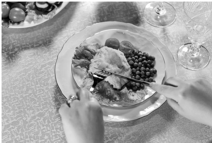
Рис. 10. Прослеживание ножом по куску мяса в сторону вилки. Касание ножом вилки

5. Удерживая вилку, осторожно проследите лезвием ножа по куску в сторону вилки до того момента, пока не коснетесь ножом вилки (рис. 10).