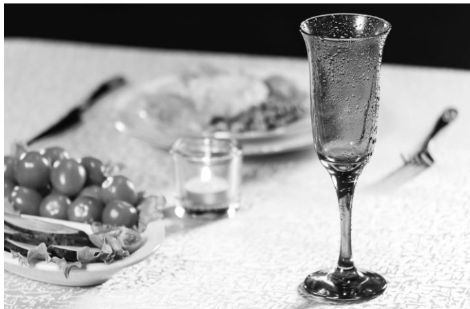
Рис. 17. Использование цветного стекла, контрастного по отношению к скатерти, при сервировке стола для слабовидящих людей

ная и стеклянная посуда; для напитков используется посуда из хрусталя и стекла. Для удобства слабовидящих людей можно использовать цветное стекло, так как неокрашенные прозрачные фужеры и тарелки часто сложно увидеть (рис. 17).