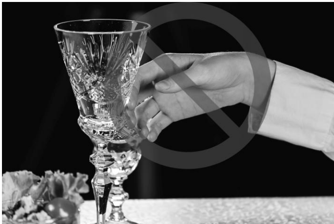
Рис. 3. Неправильный прием поиска предметов сервировки, можно опрокинуть бокал