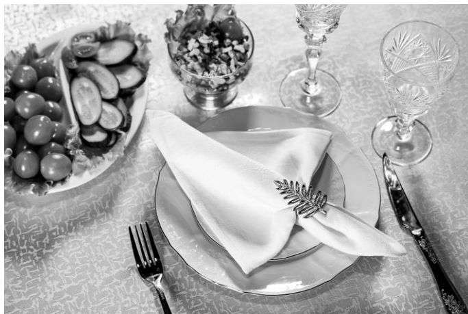
Рис. 24. Текстильная салфетка в кольце

лучше держать форму и меньше пачкаться. Салфетки выполняют не только практическую функцию, но и эстетическую. Текстильные салфетки, отглаженные и сложенные, кладут или слева от тарелки или на тарелку. Для украшения салфеток могут быть использованы специальные кольца — эти аксессуары сегодня считаются классическим вариантом оформления салфеток. Кольца для салфеток могут быть изготовлены из разного материала и подбираются в зависимости от стиля оформления стола. Для каждого гостя нужно подготовить одну текстильную и несколько бумажных салфеток.