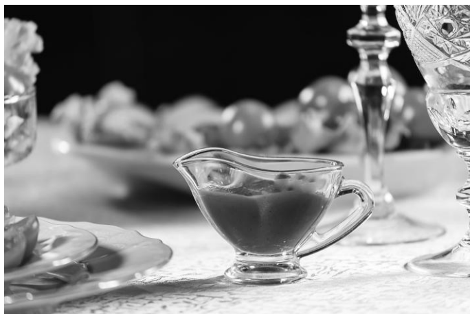
Рис. 25. Индивидуальная розетка для соуса

Если к горячему блюду подаются салаты, всегда удобнее и эстетичнее использовать небольшой индивидуальный салатник. Во-первых, наличие салата на тарелке вместе с гарниром и горячим блюдом выглядит не очень красиво, во-вторых, слепому или слабовидящему будет удобнее есть, если салат находится в отдельном салатнике, а основное блюдо на тарелке, в таком случае ничего не перемешивается. Если планируется подача соуса, то стоит предложить гостям индивидуальные розетки для соуса (рис. 25).