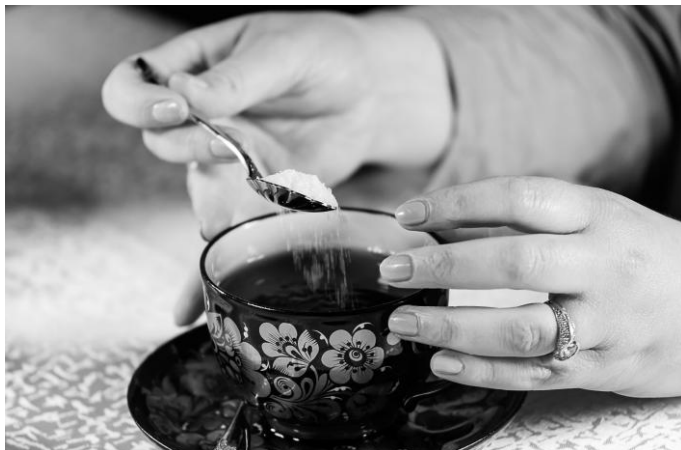
Рис. 15. Положение рук во время высыпания сахара в чашку из чайной ложки

Слепым и слабовидящим людям зачастую проще использовать кусковой сахар, который раскладывается по чашкам специальными щипцами или сервировочной ложечкой. При использовании сервировочной ложечки нельзя опускать ее в свою чашку с чаем или кофе.