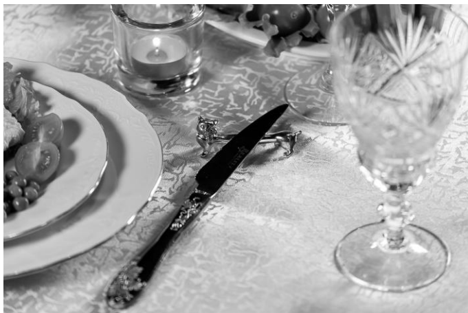
Рис. 12. Подставка под столовый нож

скатерть. Нельзя класть приборы, которыми вы пользовались, на скатерть.