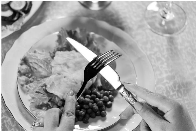
Рис. 7. Определение с помощью вилки режущей стороны столового ножа

по форме ручки, чтобы правильно взять нож. Если же ручка ровная, то можно просто провести по лезвию ножа кончиками зубьев вилки: на режущей стороне столового ножа имеются зазубрины, которые вы почувствуете (рис. 7).