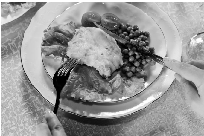
Рис. 8. Осматривание с помощью вилки и ножа размеров и расположения куска мяса на тарелке

нужно для того, чтобы кусок не сдвинулся с места, когда вы будете работать вилкой (рис. 9).