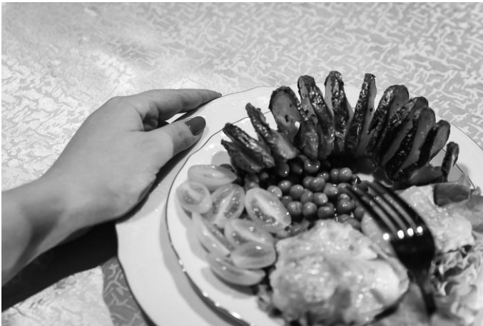
Рис. 4. Контролирующая край тарелки свободная рука