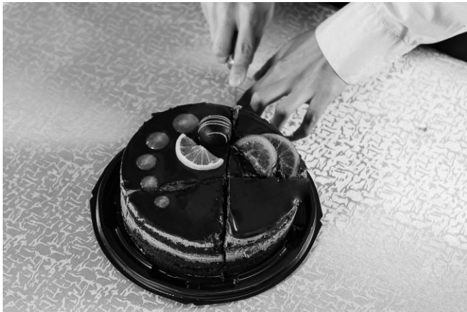
Рис. 21. Перенесите свободную руку вниз на противоположную сторону торта и осуществите разрез в направлении этой руки

В тарелки кусочки торта переносятся с помощью специальной лопатки для торта. Для того чтобы во время перекладывания кусок торта не упал, придерживайте его столовым ножом, а не пальцами. Для этого сначала поместите нож между кусками торта (нож в правой руке), лопаткой подденьте кусочек торта, находящийся слева от ножа. Имейте в виду, что торт может стоять на дополнительном картонном круге, поэтому, когда берете кусочек торта на лопатку, проверьте, приподняв немного лопатку, не зацепили ли вы картон. Приподняв торт на лопатке, наклоните его немного в сторону ножа, чтобы он не упал с лопатки, и положите кусочек на тарелку.