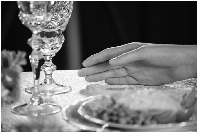
Рис. 2. Правильное прослеживание рукой по столу во время обследования и поиска предметов сервировки