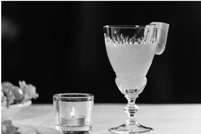
Рис. 14. Индикатор уровня жидкости, размещенный на краю бокала