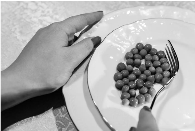
Рис. 5. Сдвигание прибором остатков еды на тарелке в сторону контролирующей руки