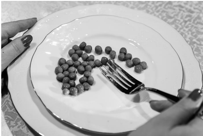
Рис. 6. Последовательное осматривание тарелки выпуклой стороной вилки для определения остатков пищи

Старайтесь во время еды не допустить падения пищи из тарелки на стол. Если что-то все же упало на скатерть, то аккуратно соберите кусочки еды со стола бумажной салфеткой, сверните ее и положите под край тарелки. Не следует складывать упавшие куски обратно в тарелку и тем более съесть то, что собрано со стола.