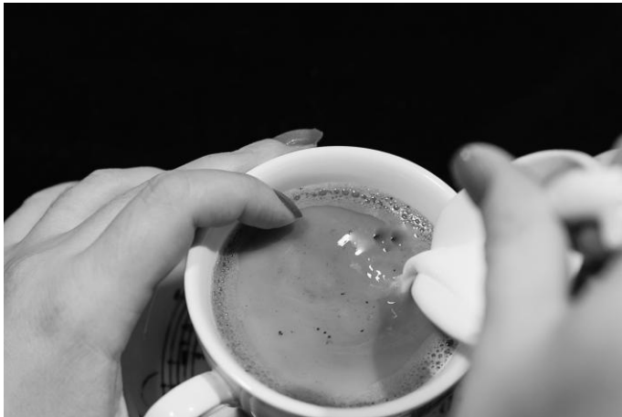
Рис. 13. Использование указательного пальца для определения уровня жидкости в чашке