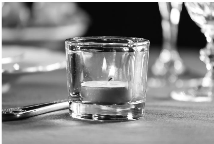
Рис. 26. Устойчивый подсвечник, закрывающий пламя свечи

ким и резким запахом. Перед тем как поставить цветы на стол, потрясите их, для того чтобы убедиться, что с них не осыпаются лепестки и листья. Свечи стоит ставить в подсвечниках в форме низкого бокала, так чтобы и сама свеча, и пламя находились за стенками подсвечника, тогда никто из гостей с нарушением зрения не заденет пламя (рис. 26). Для того чтобы свеча не была опрокинута, подсвечник должен быть невысокий и устойчивый. Следует в самом начале приема предупредить гостей с нарушением зрения о наличии, высоте и расположении на столе свечей, цветов и других декоративных украшений.