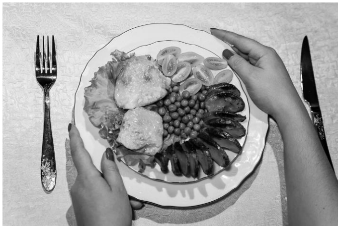
Рис. 1. Обследование размера тарелки и столовых приборов

краям тарелки, посмотрите, какая посуда стоит в правом и левом верхних углах относительно тарелки. Справа должны стоять бокалы и рюмки, определите их расположение.