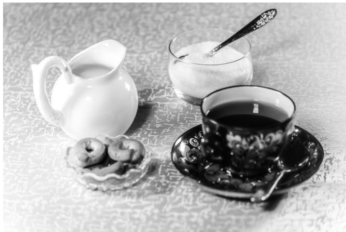
Рис. 22. Посуда и приборы для чая: чайная пара, молочник, сахарница, отдельное блюдо для угощения

После того как человек выберет то, что он хотел бы попробовать, следует положить ему все желаемое на отдельную десертную тарелку. Если человек еще что-то захочет, ему следует попросить положить на его тарелку угощение дополнительно.