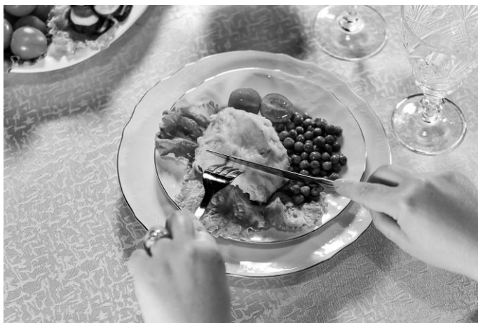
Рис. 11. Отступ ножа от вилки на 5 мм

7. Отрежьте кусочек в том положении, в каком у вас находится нож, немного надавливая и осторожно двигая лезвие вперед-назад. Когда почувствуете ножом дно тарелки, остановитесь.