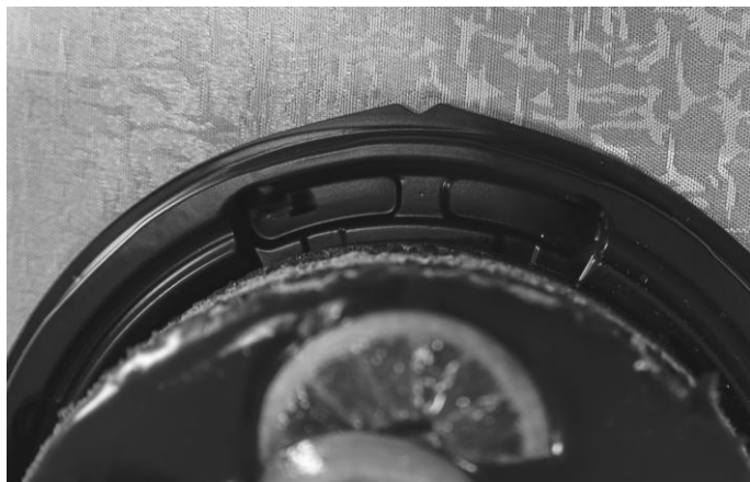
Рис. 19. На фабричных подставках для торта часто имеются четыре углубления по краям

Если торт будет подан в тесном кругу родственников и перекладываться на блюдо не будет, то обследуйте основание упаковки, в которую он был помещен, на такой подставке часто есть углубления, по которым можно сориентироваться; как правило, их четыре (расположены симметрично: на 3, 6, 9 и 12 часах) (рис. 19).