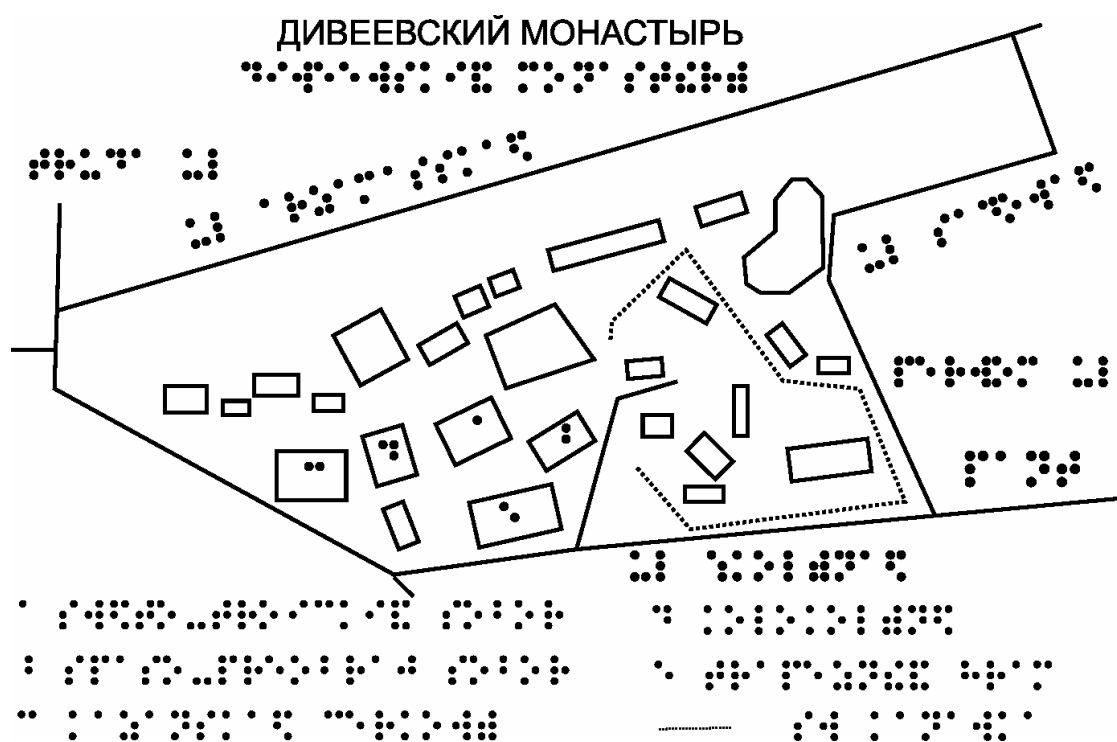
Рис.1. Пример рисунка для тактильной схемы

Рельефные изображения зданий можно делать как на основе эскизов, так и по фотографии. Следует выбирать фотографии, выполненные строго перпендикулярно, без геометрических искажений. Отрисовывается контур, наиболее крупные, значимые элементы.